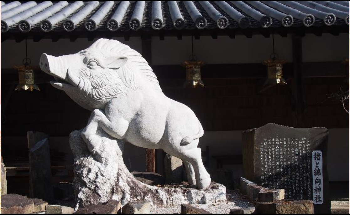
馬見岡綿向神社（滋賀県蒲生郡日野町）